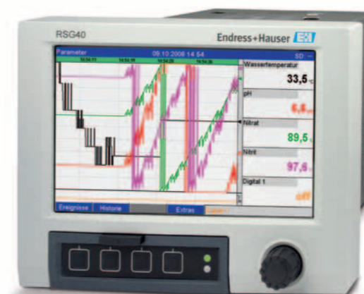
Memograf M se 7-palcovým TFT-displejem