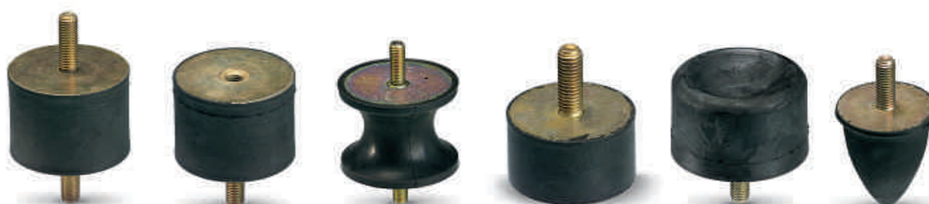
Válcové nárazníky a dorazové nárazníky APSOvib®

lace lze vypočítat potřebný vlastní kmitočet hmoty pružiny a potřebné odpružení tlumícího prvku. Hmotnost a odpružení jsou tedy veličiny, na jejichž základě je třeba hledat adekvátní tlumič. Každý ze třinácti tvarů tlumičů ze sortimentu Angst+Pfister se dodává ve třech stupních tvrdosti – „střední“ (standard), „měkký“ nebo „tvrdý“. Není-li optimální kruhový tlumič střední tvrdosti ze standardního sortimentu vhodný pro vaše potřeby, nabídne vám měkké nebo tvrdé provedení další možnost optimalizace.