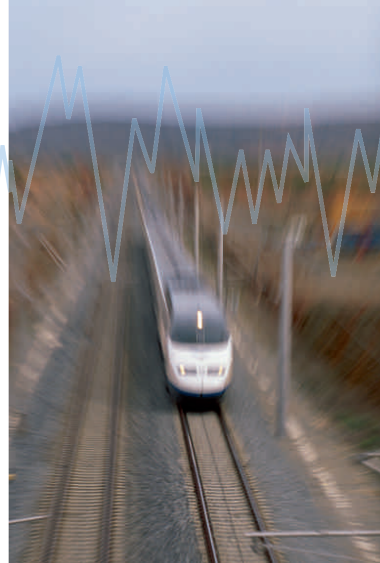
Kruhové nárazníky z pryže a kovu se používají v nejrůznějších průmyslových oborech.

lace lze vypočítat potřebný vlastní kmitočet hmoty pružiny a potřebné odpružení tlumícího prvku. Hmotnost a odpružení jsou tedy veličiny, na jejichž základě je třeba hledat adekvátní tlumič. Každý ze třinácti tvarů tlumičů ze sortimentu Angst+Pfister se dodává ve třech stupních tvrdosti – „střední“ (standard), „měkký“ nebo „tvrdý“. Není-li optimální kruhový tlumič střední tvrdosti ze standardního sortimentu vhodný pro vaše potřeby, nabídne vám měkké nebo tvrdé provedení další možnost optimalizace.