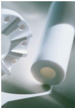
APSOplast® Tecnologia delle materie plastiche