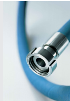
APSOfluid® Tecnologia dei fluidi